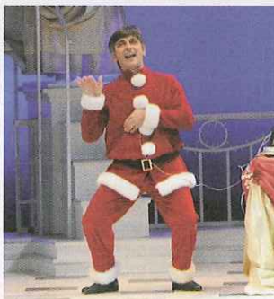
"Astice al veleno" al Manzoni

È la vigilia di Natale. Barbara, attricetta delusa dall'amante regista che non ha intenzione di lasciare la moglie, è in teatro per provare il nuovo spettacolo. Non c'è nessuno, solo le immagini della scenografia che prendono vita sotto i suoi occhi: una lavanderia del '500, uno scugnizzo, un poeta rivoluzionario delle Due Sicilie, un "muniacello" napoletano. Quando in sala irrompe un pony express vestito da Babbo Natale, Barbara decide che il suo destino deve cambiare. A partire dall'inutile relazione con il regista, che verrà troncata durante una cena. Il nuovo spettacolo di Vincenzo Salemme, Astice al veleno , è una farsa brillante con musica e canzoni. Teatro Manzoni, via Manzoni 42, dal 29 marzo al 17 aprile. Biglietti 30/20 euro. Tel. 027636901. (s.ch.)