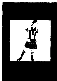
Colin Dexter, 'Al momento...', Sellerio, 404 pagine, 14 euro

L'intuitivo ispettore Morse è alle prese con un vecchio caso, una studentessa non ancora 18enne scomparsa nel tragitto casa-scuola. Ora, a distanza di due anni, una lettera ne smentisce l'ipotesi della morte e solo il giorno dopo il collega che seguiva l'indagine muore in un incidente automobilistico. Morse è abbastanza fantasioso da concepire «l'idea più strampalata del mondo» e comincia a rifare i passi presunti del collega morto. Le inchieste di Morse appartengono al poliziesco della migliore tradizione inglese. Colin Dexter vi aggiunge il talento letterario di arricchire il ritmo della storia con le situazioni particolari dei molti personaggi.