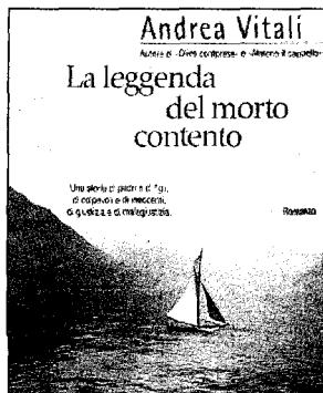
Andrea Vitali, 'La leggenda del morto contento', Garzanti, 238 pagine, 18,60 euro

Torna in edizione straordinaria per i 150 anni dell'Unità di Italia il Libro dei Fatti 2011. Per l'occasione, in un inserto speciale, le massime autorità istituzionali hanno inviato in esclusiva un appello ai lettori. Tre milioni di copie, 16.000 notizie, 14.000 protagonisti, migliaia di foto, quiz, tabelle e statistiche. Sono questi i numeri del volume, frutto di un'associazione di impresa editoriale tra Adnkronos Libri e società Autogrill, che contiene le informazioni sugli avvenimenti più importanti o curiosi dell'anno appena trascorso.